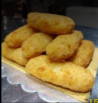
Crocchè di patate (fatti a mano) 1pz