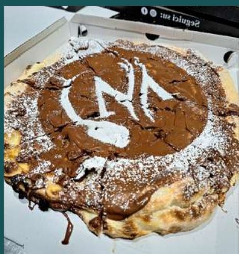
PIZZA NUTELLA NORMALE