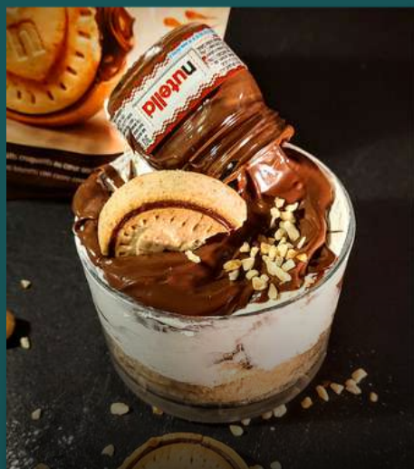
CHEESCAKE ALLA NUTELLA 5€