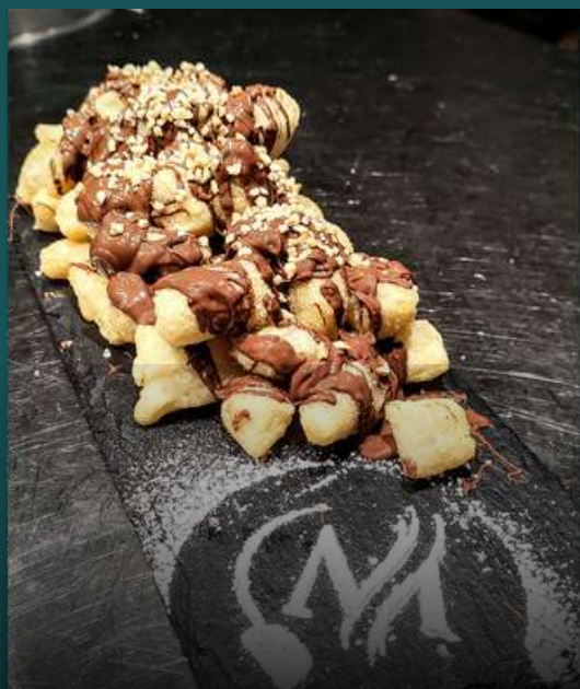
GNOCCHETTI FRITTI ALLA NUTELLA