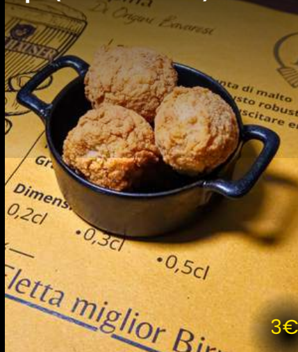
Mozzarelline panate 4pz (Fatte a mano)