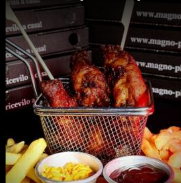
Alette di pollo (4pz)