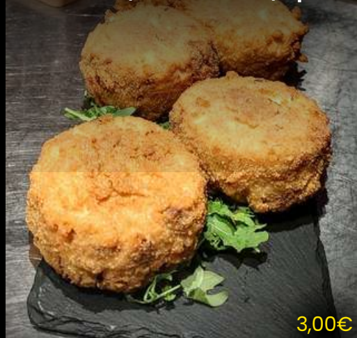
Frittatina di pasta Carbonara (fatta a mano) 1pz