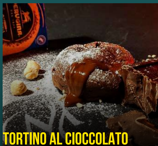
TORTINO AL CIOCCOLATO