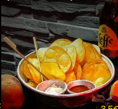
Patatine Chips (fatte a mano)