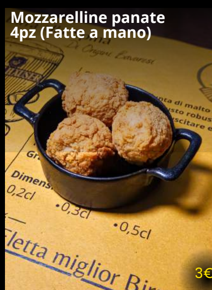
Mozzarelline panate 4pz (Fatte a mano)