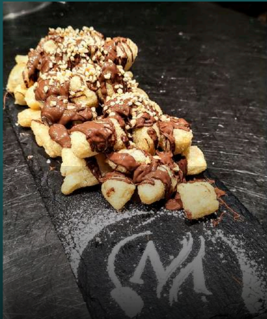
GNOCCHETTI FRITTI ALLA NUTELLA 4,5€