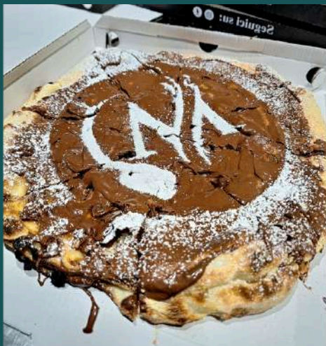
PIZZA NUTELLA NORMALE