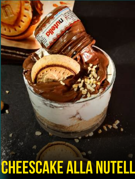
CHEESCAKE ALLA NUTELLA 5€