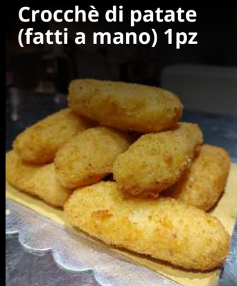
Crocchè di patate (fatti a mano) 1pz