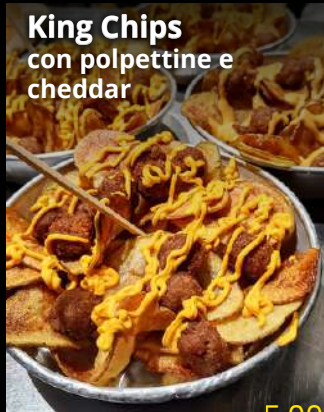
King Chips con polpettine e cheddar