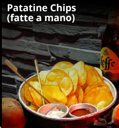
Patatine Chips (fatte a mano)