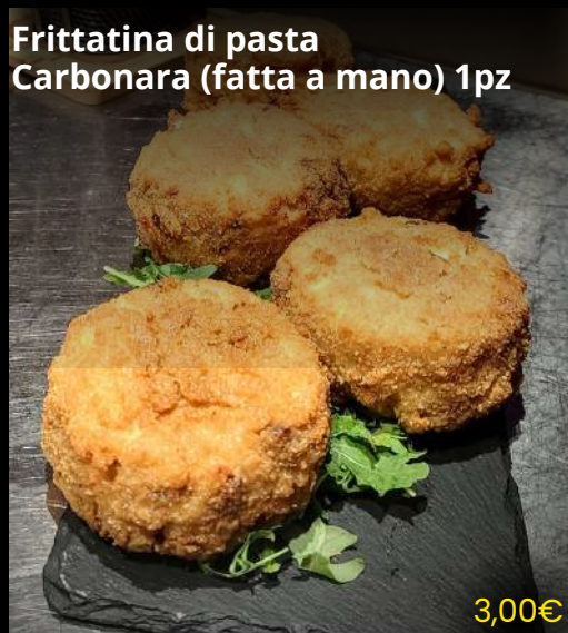
Frittatina di pasta Carbonara (fatta a mano) 1pz