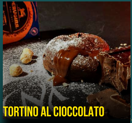
TORTINO AL CIOCCOLATO