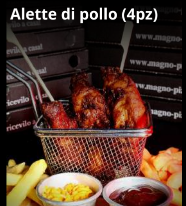
Alette di pollo (4pz)